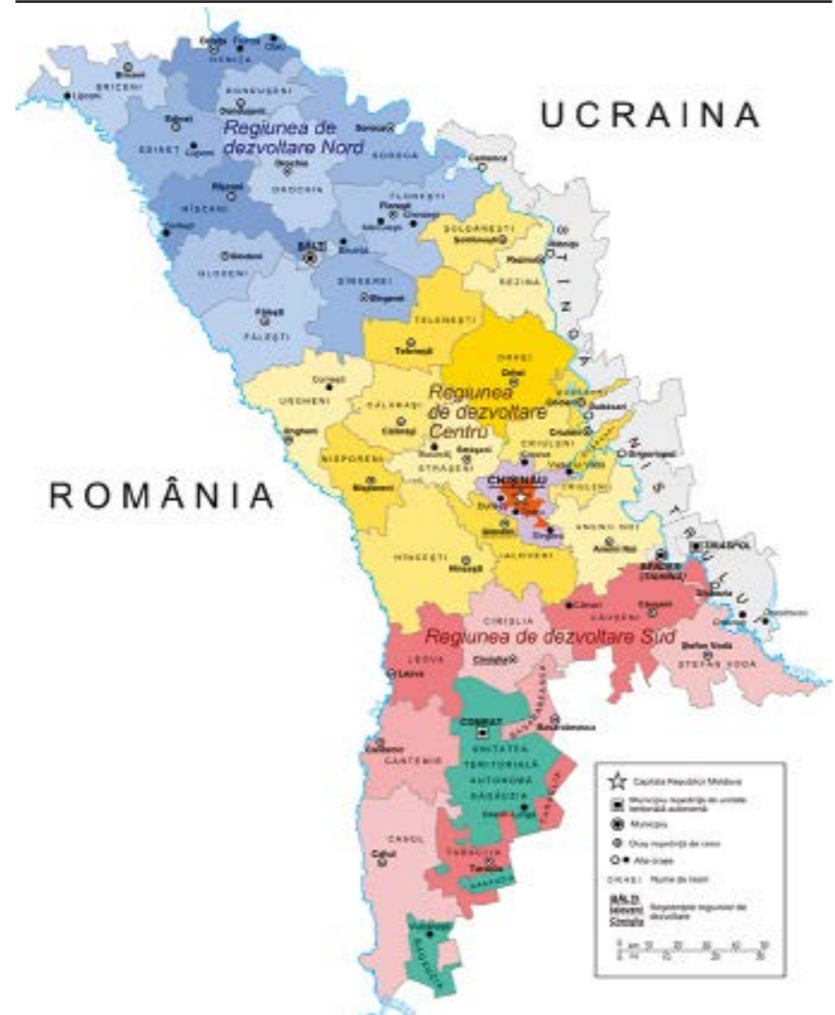
Մոլդովայի Հանրապետության վարչաքաղաքական քարտեզը:

Ուսուցիչը քարտեզի վրա ցույց է տալիս Մոլդովայի ներկայիս տարածքային բաժանումը: Սովորողներն ուսուցչի հետ ստեղծում են կարճ ժամանակացույց, որտեղ նշում են 3-4 հիմնական շրջադարձային կետեր, որոնք ազդել են նման բաժանման ձևավորման վրա 1989–1994թթ: