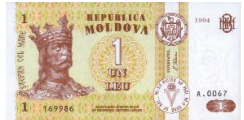
1993 թ. նոյեմբերի 29-ին Մոլդովայի Հանրապետությունում ներդրվեց ազգային արժույթը՝ մոլդովական լեյը: