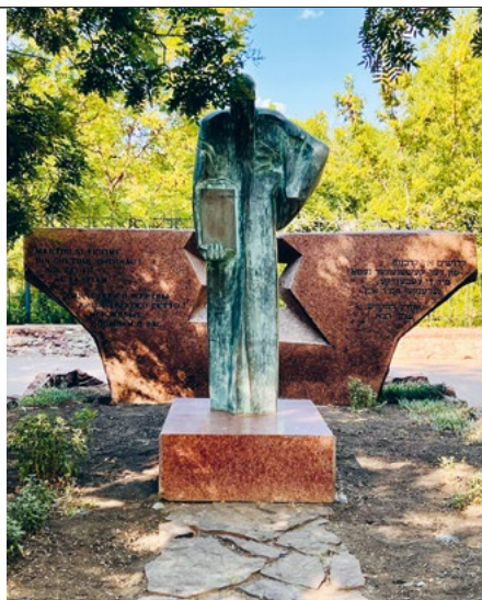
Памятник жертвам еврейского гетто, 2022 г.