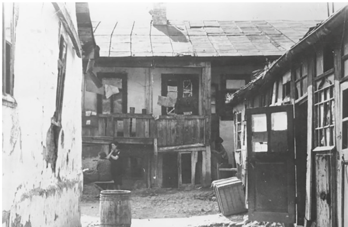
Кишиневское гетто, 1941 г.

В каких условиях жили люди в Кишиневском гетто?