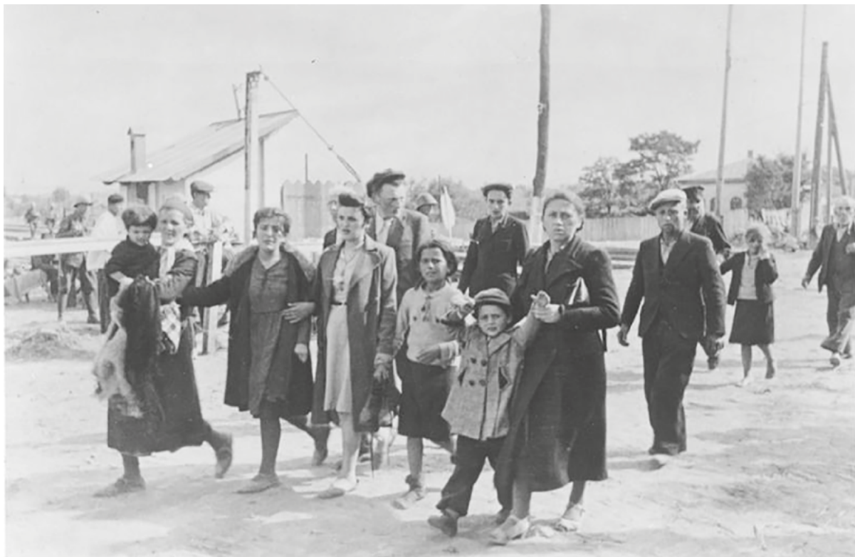
Евреев сгоняют в гетто, 1941

Рассмотрите фотографии и ответьте на вопросы