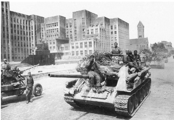
Советские самоходные артиллерийские установки в освобожденном Минске, 1944 г.