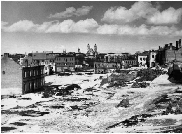
Минск после бомбардировки, 1939 г.