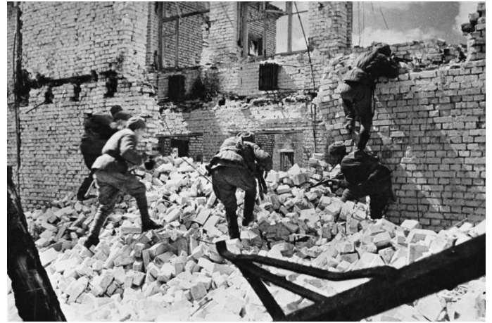
Сталинградская битва, 1942-1943 гг.