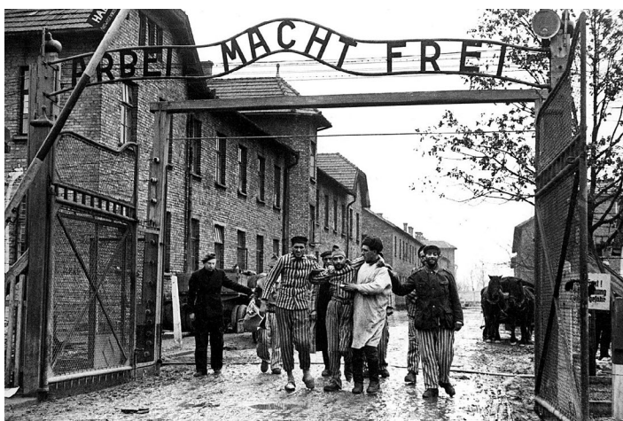
Советские солдаты с освобожденными узниками у ворот концентрационного лагеря Аушвиц (Освенцим)