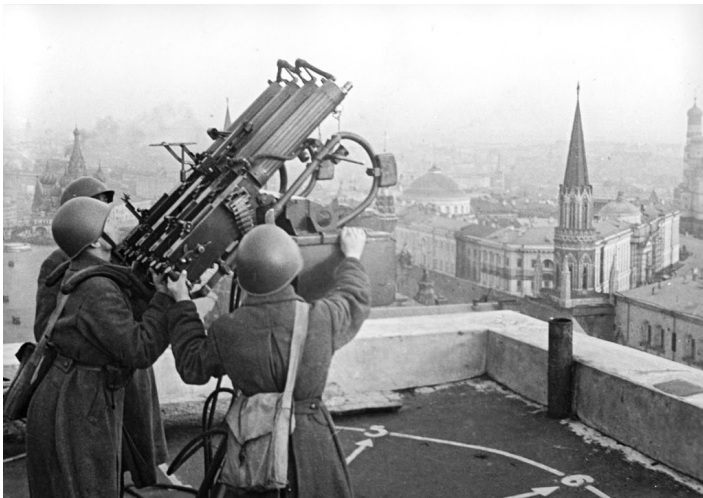
Советская противовоздушная оборона в Москве, 1941 г.