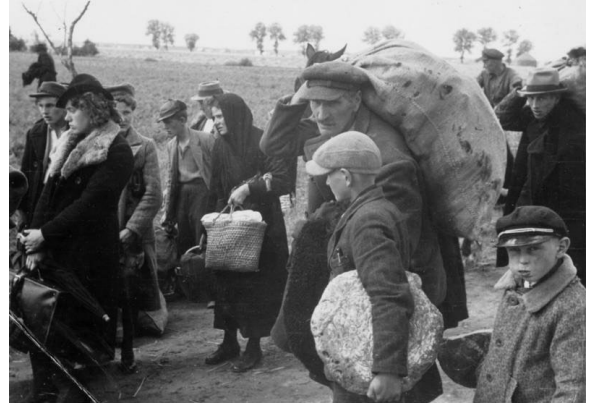
Изгнание поляков из Великой Польши, 1939-1940 гг.

Национальное управление архивов и документации. Изображение № 111-SC-206292. Публичная собственность, не защищенная авторским правом: Wikipedia