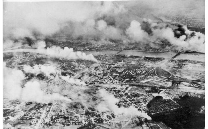
Бомбардировка Варшавы, 1939 г.

Разрешено использование в некоммерческих образовательных целях для обучения и преподавания, включая внутреннее обучение: Имперский военный музей HU 5538