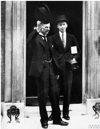
Объявление Великобританией войны Германии, 3 сентября 1939 г. – британский премьер-министр Невилл Чемберлен после объявления о том, что страна [Великобритания] находится в состоянии войны с Германией