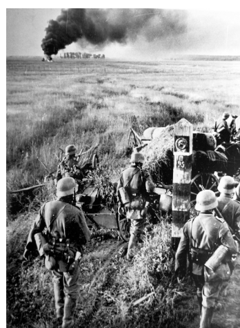
Переход советской границы немецкими войсками, 22 июня 1941 г.