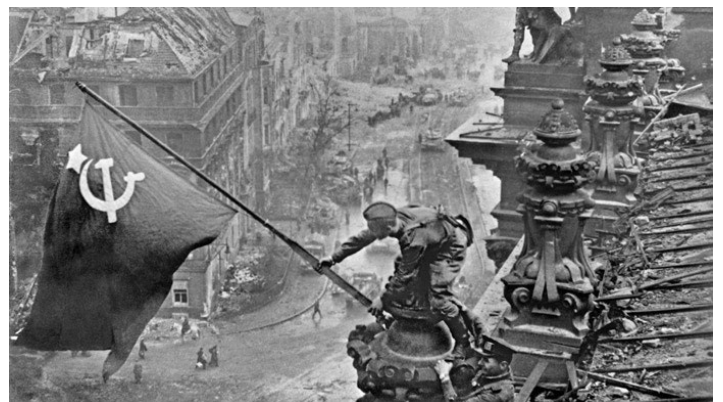
Поднятие красного знамени над Рейхстагом, 1945 г.