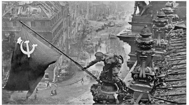
Hissen der sowjetischen Flagge über dem Reichstag, 1945