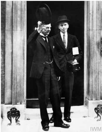
Großbritannien erklärt Deutschland den Krieg, 3. September 1939 – der britische Premierminister Neville Chamberlain, nachdem er den Kriegszustand erklärt hatte

Nichtkommerzielle Nutzung zu Bildungszwecken ist erlaubt: Imperial War Museum HU 5538