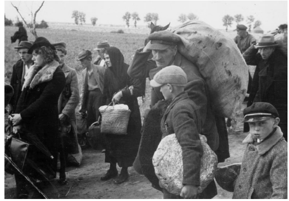
Vertreibung von Pol*innen aus Wielkopolska, 1939-1940