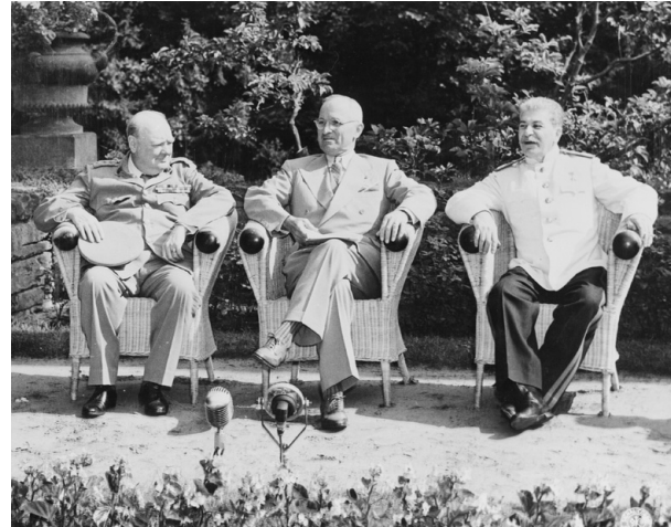
Potsdamer Konferenz, 25. Juli 1945, Deutschland