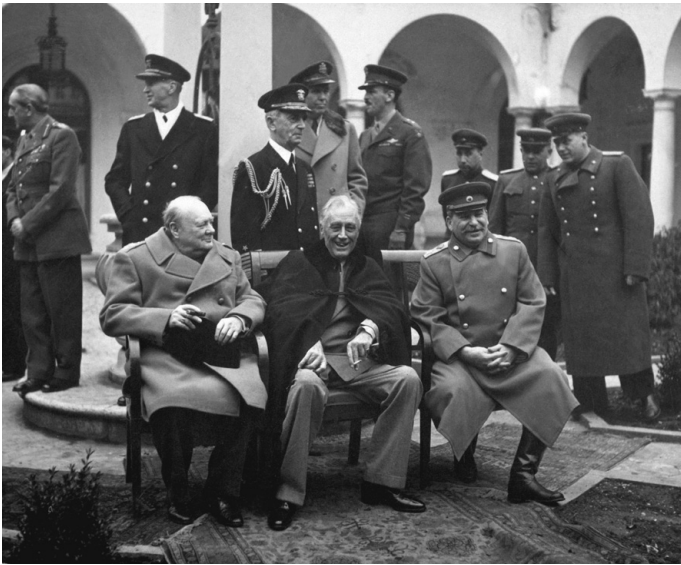
Konferenz von Jalta, Churchill, Roosevelt, Stalin