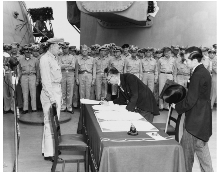
Kapitulation von Japan, Bucht von Tokio, 2. September 1945