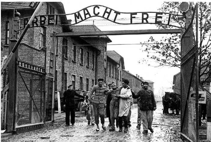
Sowjetische Soldaten mit befreiten Gefangenen am Tor des KZ Auschwitz