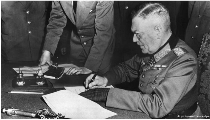
Feldmarschall Keitel unterzeichnet die deutschen Kapitulationsbedingungen, Berlin, 8. Mai 1945

US-Armee Lieutenant Moore. Nationale Verwaltungsstelle für Archivgut und Unterlagen. Foto# 111-SC-206292, archives.gov. Lizenzfrei: Wikipedia