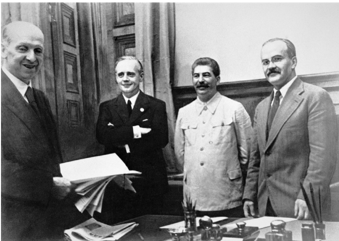
Deutsch-sowjetischer Nichtangriffspakt (Molotow-Ribbentrop-Pakt), 23. August 1939