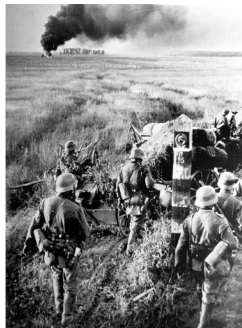
Deutsche Soldaten überqueren die sowjetische Grenze, 22. Juni 1941