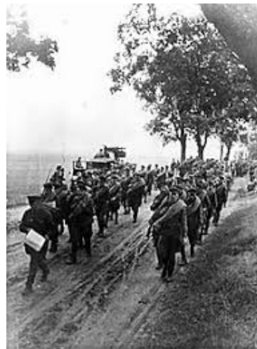
Sowjetische Truppen marschieren in Polen ein, 1939