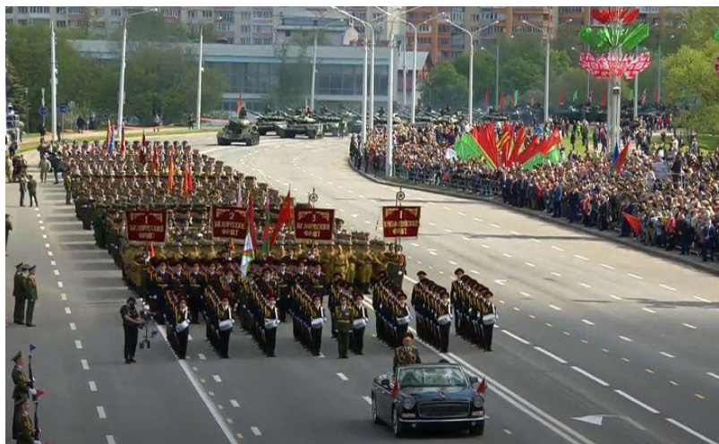
Парад Победы, Минск, Беларусь.

9 мая в столице Беларуси проходит парад Победы – торжественное шествие армии, роты почетного караула, разных подразделений силовых структур страны, демонстрация военной техники и др. На парад приглашают ветеранов войны, школьников и студентов, представителей общественных организаций. Парад принимает лично Президент Беларуси.