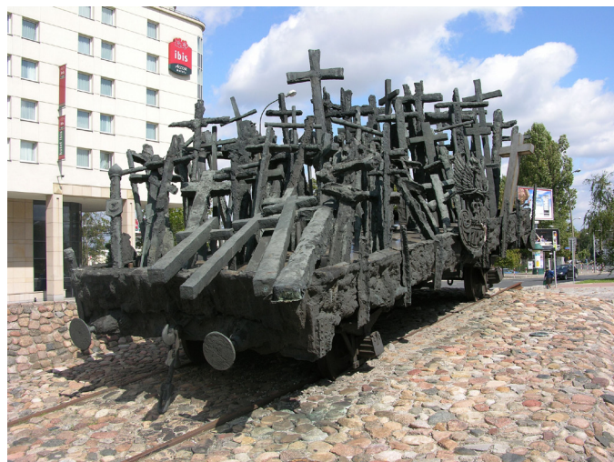
Монумент погибшим и убитым на востоке, Варшава, Польша