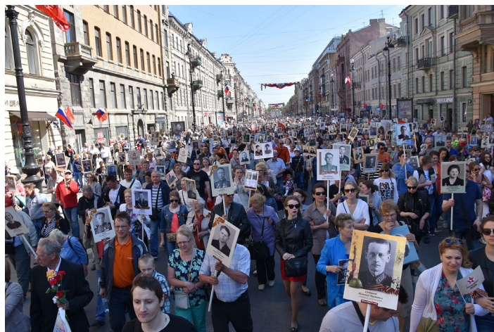
Бессмертный полк в Санкт-Петербурге.

Главная задача «Бессмертного полка» – сохранение в каждой семье личной памяти о поколении, прошедшем Великую Отечественную войну (название, используемое в России и в странах бывшего СССР применительно ко Второй мировой войне). Участие в «Бессмертном полку» подразумевает, что каждый, кто помнит и чтит своих родственников (солдат и моряков, партизан, подпольщиков, участников Сопротивления, тружеников тыла, узников концлагерей, блокадников, детей войны), выходит 9 Мая на улицы с фотографией такого родственника (или с его/ее именем, если фотографии нет), чтобы принять участие в параде в рядах «Бессмертного полка». Люди также лично отдают дань памяти военному поколению: приносят транспарант с портретом, именем или фотографию к Вечному огню – еще одному месту памяти. Участие в «Бессмертном полку» строго добровольное.