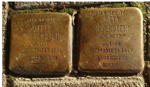
«Камни преткновения» в Дюссельдорфе.

Одна из форм сохранения памяти – создание «камней преткновения», которые представляют собой самый масштабный децентрализованный мемориал в мире. Бетонные камни с гравировкой размером 9,6 x 9,6 см установлены на дорогах в более чем 20 странах Европы. Место их установки неслучайное: «камни преткновения» размещают у дома, где жил человек – невинная жертва нацизма. На латунной пластинке каждого «камня преткновения» указывают имя и дату рождения жертвы, ниже – дату депортации и место смерти. Само название «камни преткновения» рассказывает нам о цели их создания: идущий по улице человек, увидев на дороге необычный камень, остановится и прочтает имя, выгравированное на нем, что позволит сохранить память об одном конкретном человеке, погибшем в результате преступлений национал-социалистического режима. Например, ниже представлены «камни преткновения», находящиеся у дома на набережной Рейна в Дюссельдорфе.