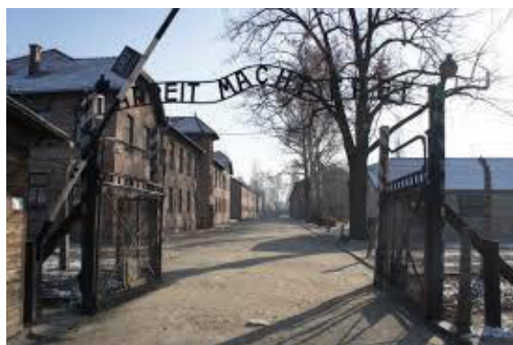
Аушвиц, Освенцим, Польша.

3. Польша и Беларусь: одиннадцать мужчин и женщин в возрасте от 20 до 27 лет, среди которых были поляки и белорусы, провели перформанс на месте бывшего нацистского лагеря Аушвиц. Зарезав несколько овец ножами, они разделись догола и приковали себя друг к другу и к ограде. Молодые люди также водрузили на ворота концлагеря белое знамя с надписью «любовь» красного цвета вместо слова «труд» (оригинальная надпись: «Труд освобождает» («Arbeit macht frei»)), призвав к осуждению войн в мире 3 .