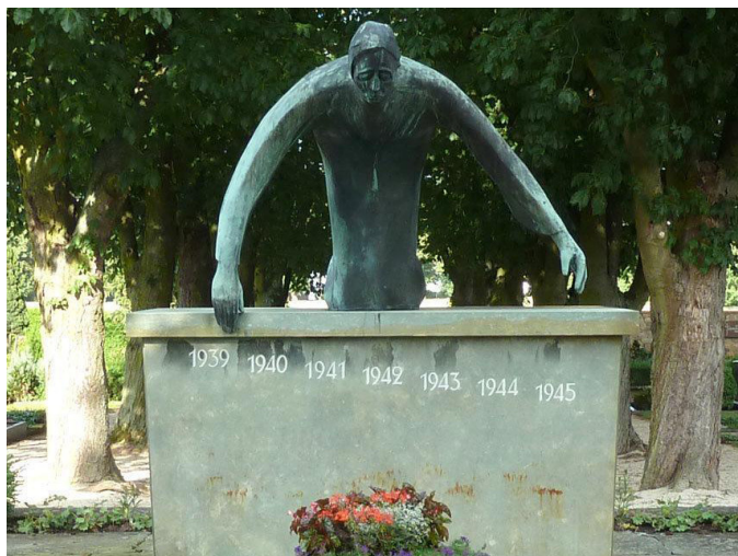
Монумент жертвам войны, Бад-Наухайм, Германия