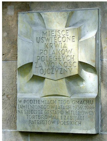
Мемориальная доска в Варшаве, Польша.

Надпись на одной из мемориальных досок на здании по аллее Шуха в Варшаве, спроектированном в 1949 г. Каролем Чореком, гласит: «Место, залитое кровью поляков, погибших за свободу Родины».