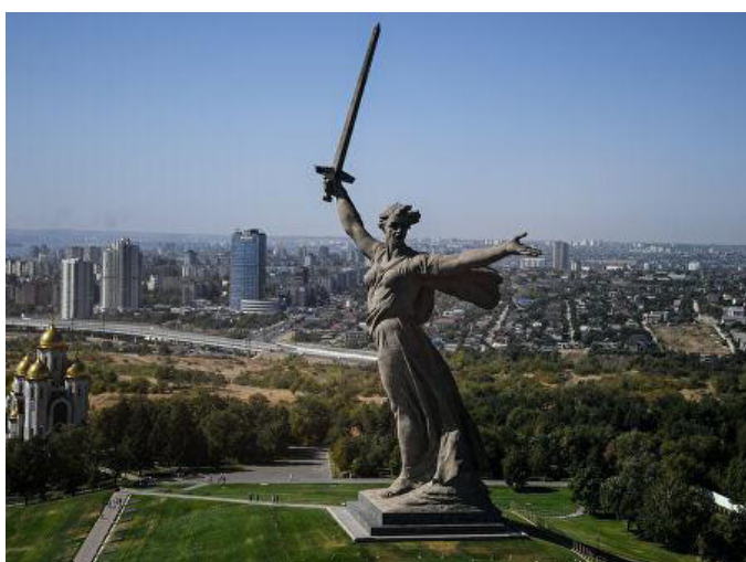
Pomnik Matka Ojczyzna Wzywa w Wołgogradzie, Rosja