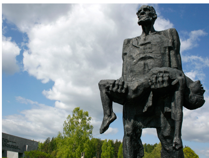
Pomnik „Niepokonani” w spalonej wsi Chatyń (Białoruś)