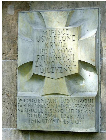
Tablica pamiątkowa w Warszawie, Polska.

Jedna z tablic pamiątkowych na budynku przy Alei Szucha w Warszawie, zaprojektowana w roku 1949 przez Karola Tchorka: „Miejsce uświęcone krwią Polaków poległych za wolność Ojczyzny”.