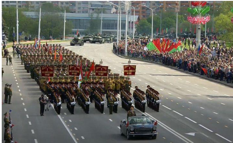
Parada Zwycięstwa w Mińsku, Białoruś.

9 maja w stolicy Białorusi organizowana jest Defilada Zwycięstwa. Maszerują w niej wojsko, Kompania Honorowa Komendanta Wojskowego Mińska, różne jednostki sił bezpieczeństwa kraju,; prezentowany jest sprzęt wojskowy itp. Do udziału w defiladzie zapraszani są weterani wojenni, uczniowie i studenci oraz przedstawiciele organizacji społecznych. Defiladę odbiera osobiście prezydent Białorusi.