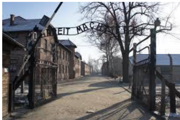
Niemiecki nazistowski obóz koncentracyjny i zagłady Auschwitz-Birkenau, Oświęcim, Polska.

3. Polska i Białoruś: jedenaście osób w wieku 20-27 lat, Polacy i Białorusini, wykonali performance na terenie dawnego niemieckiego obozu Auschwitz. Rozebrali się do naga i przykuli się do siebie i do płotu, wcześniej zarzynając nożami kilka owiec. Młodzi ludzie wywiesili też białą flagę z czerwonym napisem „love” zamiast „Arbeit” na bramie obozu (napis głosi „Arbeit macht frei”, „Praca czyni wolnym”). Nawoływali do potępienia wojen na świecie 3 .