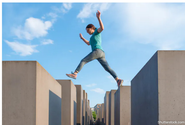
Мемарыял забітым яўрэям Еўропы, Берлін, Германія.

1. Германія: помнік забітым яўрэям Еўропы ў цэнтры Берліна. Помнік часта выкарыстоўваюць дзеці і маладыя людзі для сэлфі, заняткаў ёгай і проста для забаў, дзе хлопцы і дзяўчаты скачуць, бегаюць, выкладваюць фатаграфіі ў сацыяльныя сеткі з вясёлымі подпісамі 1 .