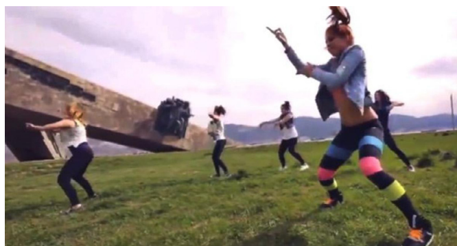
“Твэрк і Малая зямля”. Відэа: YouTube

2. Расія: у 2015 г. шэсць дзяўчат з танцавальнага калектыву ў Наварасійску станцавалі твэрк на фоне мемарыяла «Малая зямля», прысвечанага героям-вызваліцелям горада. Пасля размяшчэння відэа ў інтэрнэце група атрымала шырокую вядомасць як у сваім рэгіёне, так і ў Расійскай Федэрацыі ў цэлым 2 .