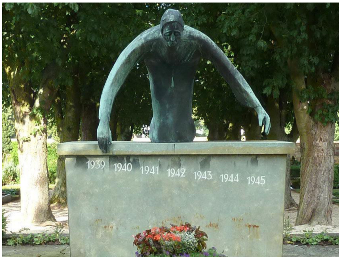
Манумент ахвярам вайны, Бад-Наўхайм, Германія