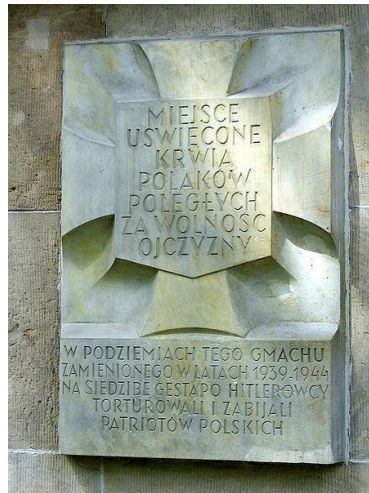
Мемарыяльная доска ў Варшаве, Польшча.