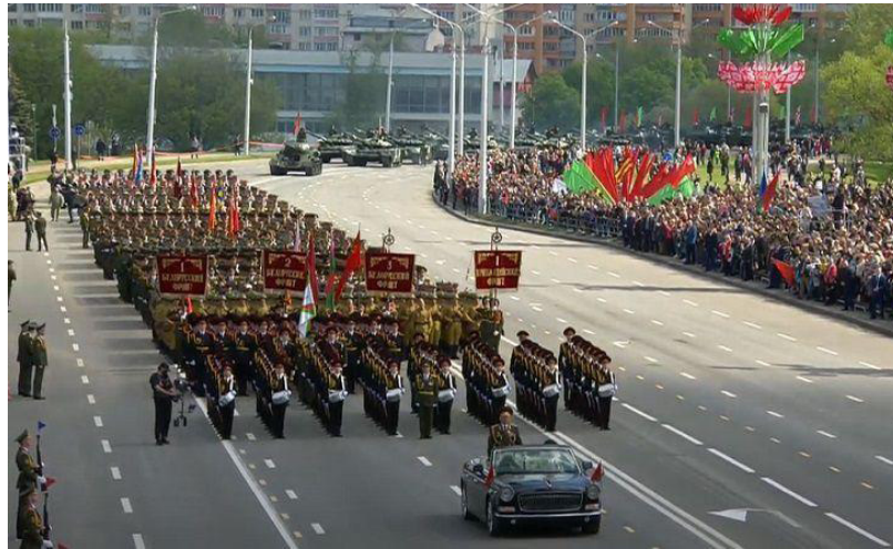
Парад Перамогі, Мінск, Беларусь.

9 мая ў сталіцы Беларусі праходзіць парад Перамогі – урачыстае шэсце арміі, роты ганаровай варты, розных падраздзяленняў сілавых структур краіны, дэманстрацыя ваеннай тэхнікі і інш. На парад запрашаюць ветэранаў вайны, школьнікаў і студэнтаў, прадстаўнікоў грамадскіх арганізацый. Парад прымае асабіста Прэзідэнт Беларусі.