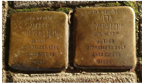
«Камяні спатыкання» ў Дзюсельдорфе.

Адна з формаў захавання памяці – стварэнне «камянёў спатыкнення», якія ўяўляюць сабой самы маштабны дэцэнтралізаваны мемарыял у свеце. Бетонныя камяні з гравіроўкай памерам 9,6 x 9,6 см устаноўлены на дарогах у больш чым 20 краінах Еўропы. Месца іх устаноўкі невыпадковае: «камяні спатыкнення» размяшчаюць каля дома, дзе жыў чалавек – нявінная ахвяра нацызму. На латуневай пласцінцы кожнага «каменя спатыкнення» ўказваюць імя і дату нараджэння ахвяры, ніжэй – дату дэпартацыі і месца смерці. Сама назва «камяні спатыкнення» гаворыць нам пра мэту іх стварэння: пойдзе па вуліцы чалавек, убачыць на дарозе незвычайны камень, спыніцца і прачытае імя, выгравіраванае на ім, што дазволіць захаваць памяць пра аднаго канкрэтнага чалавека, які загінуў у выніку злачынстваў нацыянал-сацыялістычнага рэжыму. Напрыклад, ніжэй прадстаўлены «камяні спатыкнення», якія знаходзяцца каля дома на набярэжнай Рэйна ў Дзюсельдорфе.